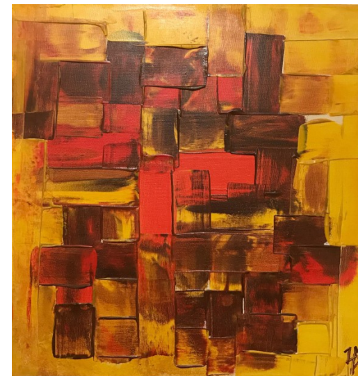
Stagioni acrilico cm. 40x40