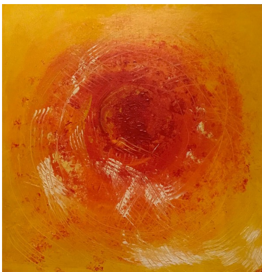
Stagioni acrilico cm. 40x40